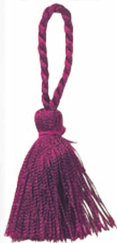
166-90 レーヨンタッセル